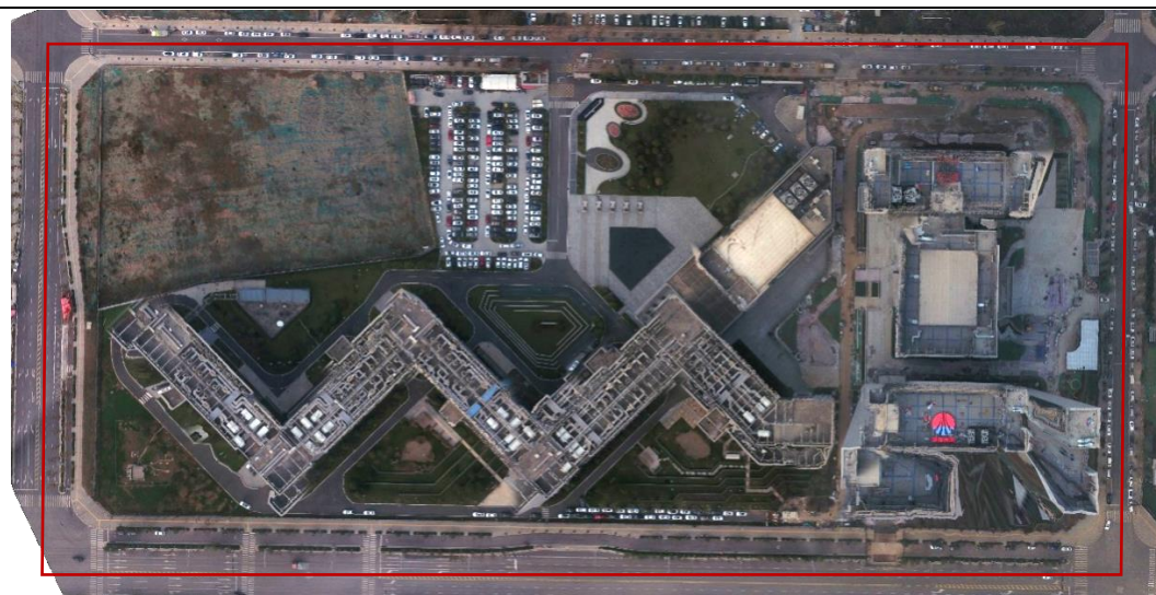
项目区航拍图（2022年12月）