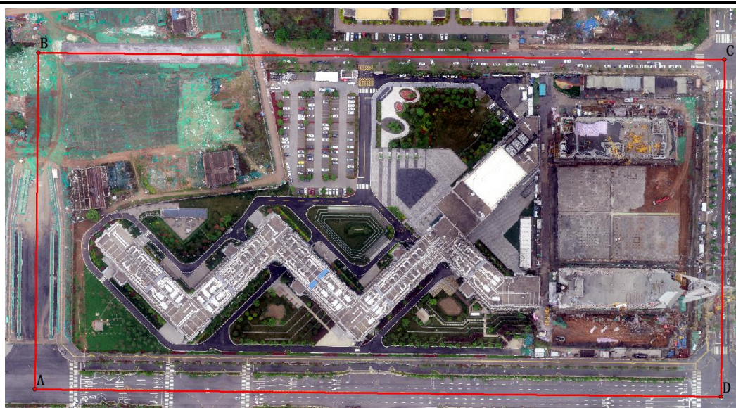
项目区航拍图（2021年6月）